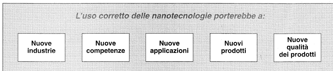
Tavola 2 - I possibili effetti dell'uso delle nanotecnologie